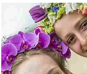
Merano Flower Festival