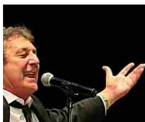
L'attore cancella lo show «Ho chiuso con Bolzano la Comune non mi paga»