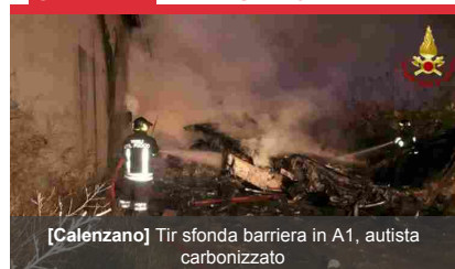
[Calenzano] Tir sfonda barriera in A1, autista carbonizzato