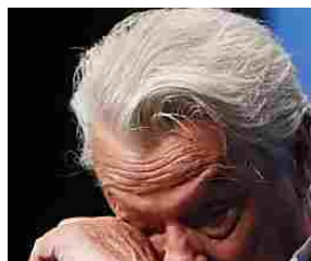
Delon tra le lacrime, è la fine di tutto