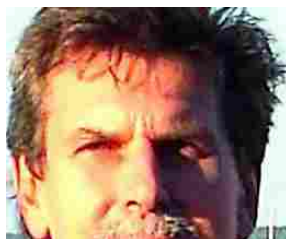
Arrestato medico del San Maurizio