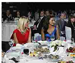
Tentata truffa, condannata Ornella Muti