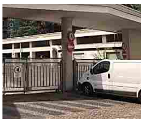
Inizia l'operazione WaltherPark Il maxicantiere durerà tr...