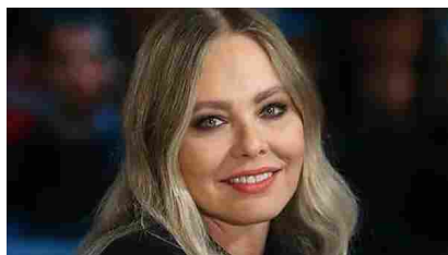
Si diede malata ma era a cena con Putin, condannata Ornella Muti - Cronaca