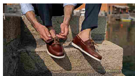
Gli intermediari alzano i prezzi, noi li saltiamo. Ecco Velasca Velasca