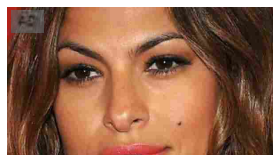
I figli delle star che sono identici ai genitori! ALFEMMINILE