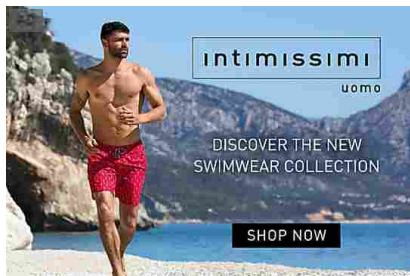
Vivi l'estate con stile. Scopri la nuova collezione mare Intimissimi Uomo. Intimissimi Shop