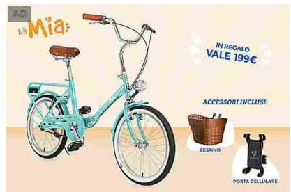
Unieuro: ecco i prodotti che ti regalano La Mia, una bici dal valore di 199€! Unieuro