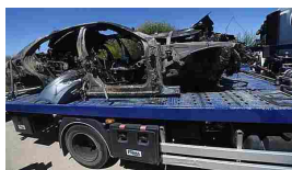
Morto Reyes: polizia, andava a 237kmh - Calcio