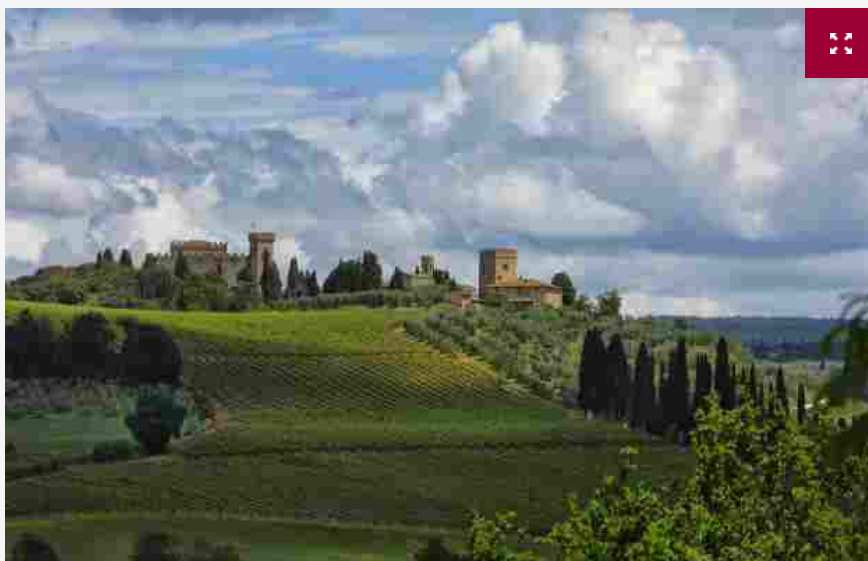
I vigneti del Chianti, la denominazione più grande della Toscana

La Toscana del vino continua a tirare, e soprattutto grazie alle sue grandi espressioni in rossi, dal Brunello di Montalcino al Chianti Classico, da Bolgheri al Nobile di Montepulciano, alla più grande denominazione della Regione, il Chianti, continua a crescere sui mercati. Tanto che, dal 2013 al 2018, l'export dei rossi Dop di Toscana è cresciuto molto, soprattutto nei paesi extra Ue, a ritmi più veloci della media nazionale: +17% negli Usa (+12% il dato nazionale) e ben +47% in Svizzera (è del 16% la