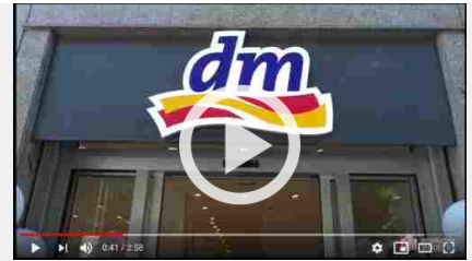
DM Drogerie Markt fa poker a Milano

Olivicoltura - Biodiversità-olivicola-italiana -