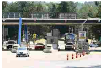
Terza corsia A1, chiuso il tratto tra Firenze sud ed Incisa Reggello