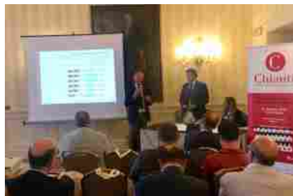
Firenze, cresce il turismo nell'area di produzione vino Chianti