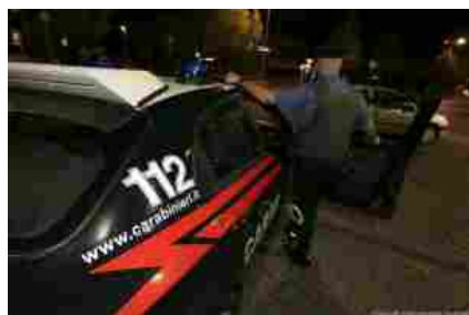
Firenze, sorpreso a cedere una dose di eroina: arrestato 21enne