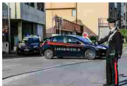
Prato, ruba degli alcolici e aggredisce commesso e Carabinieri