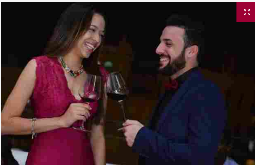
Il Chianti protagonista a Cuba

Il vino italiano a Cuba ha visto, in anni recenti, una crescita significativa tanto che il Belpaese aveva messo la freccia superando la Francia e, nel 2019, figurava come terzo partner per la "perla dei Caraibi", dietro soltanto a Spagna ed al Cile, con un valore delle importazioni di oltre 1,1 milioni di dollari, pari all'11,2% delle importazioni totali sull'isola caraibica. E con gli indicatori più in salute, frutto di una crescita dirompente che ha mostrato tutto l'appeal ed il potenziale del vino italiano a Cuba,